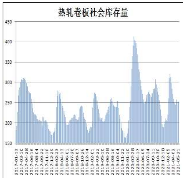
图10：全国33城热卷社会库存

6月3日，据Mysteel监测的全国33个主要城市社会库存为256.08万吨，较上周增加4.16万吨，较去年同期减少15.42万吨。