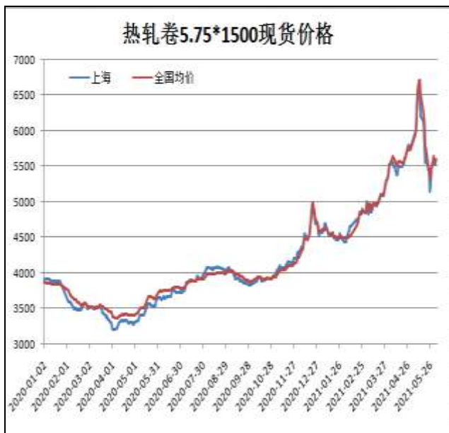
图1：热轧卷板现货价

6月4日，上海热轧卷板5.75mm Q235现货报价为5590元/吨，周环比+140元/吨；全国均价为5595元/吨，周环比+128元/吨。