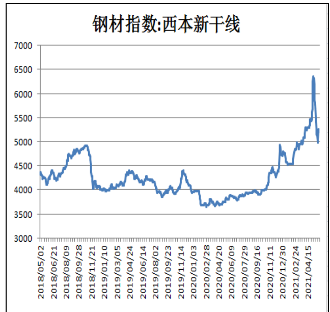
图2：西本新干线钢材价格指数

6月4日，上海热轧卷板5.75mm Q235现货报价为5590元/吨，周环比+140元/吨；全国均价为5595元/吨，周环比+128元/吨。